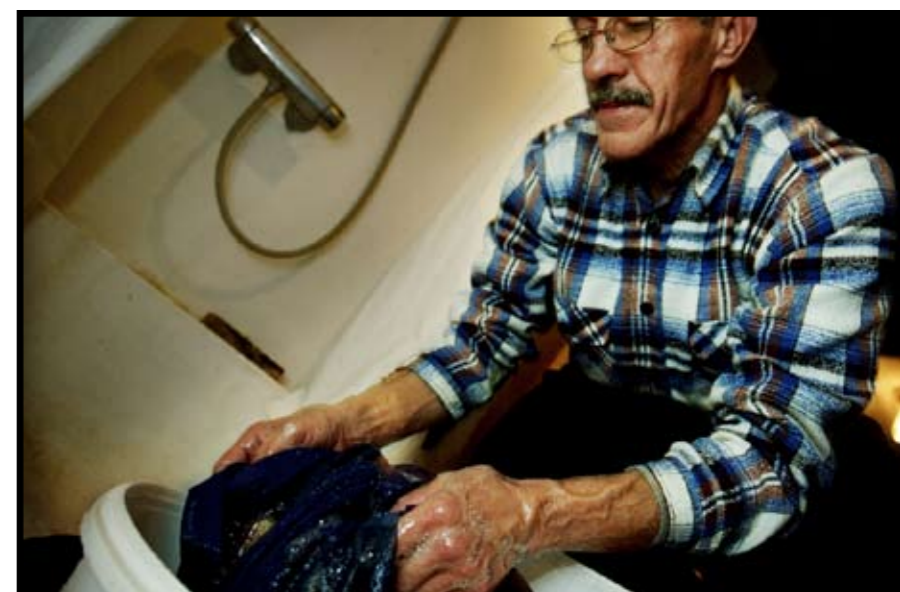
Tøjvasken. De har ikke nogen vaskemaskine i lejligheden. Meget af vasken foregår derfor i hånden. Oftest er det dagens arbejdstøj der får en tur.