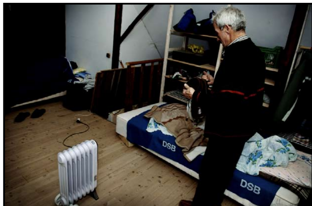
Søvn på loftet. Når trætheden melder sig, går turen op af den gamle staldtrappe. Her oppe sover de fem, på hver sin madras i samme rum. Rmmet er cirka 20 kvadratmeter.