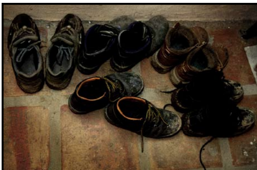
Fodkoldt. Efter 12 timer med arbejdschoene på, trænger både sko og fødder til at blive luftet og varmet. Schoene står til tørre ved brændeovnen.