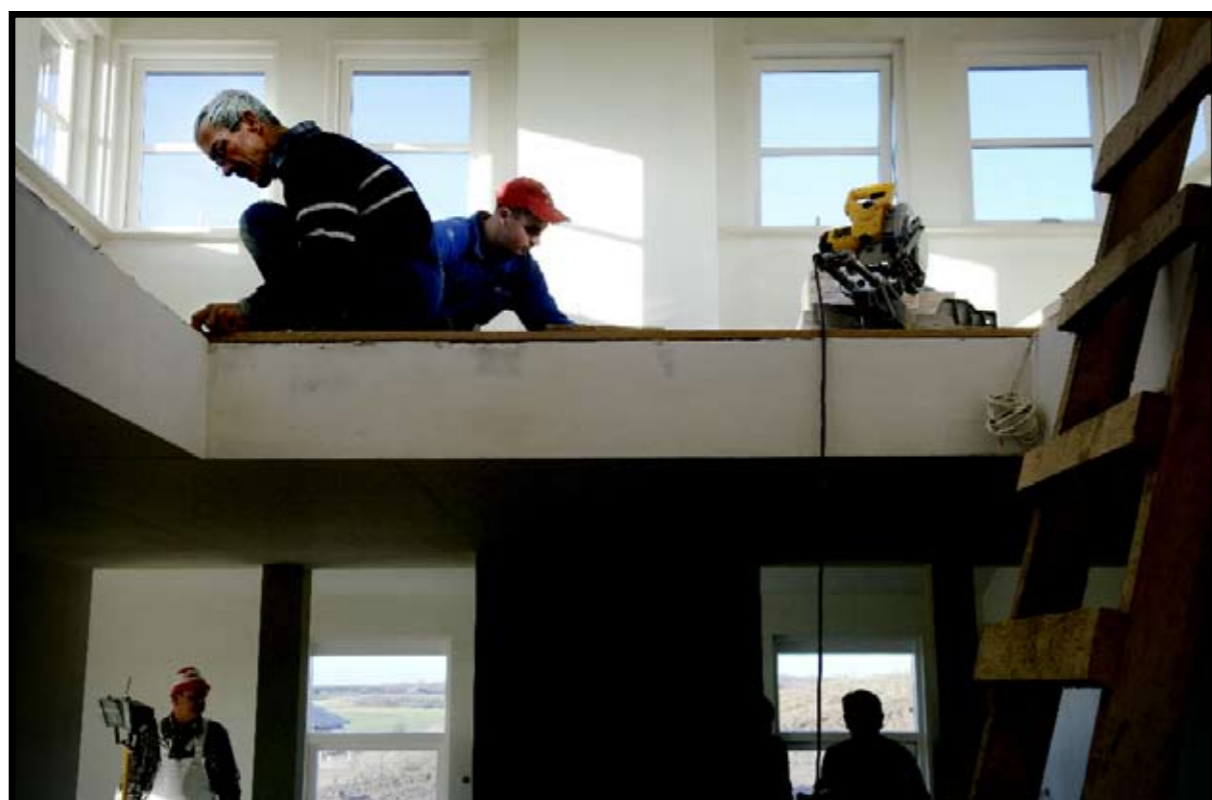
Arbejd arbejder. Effektiviteten er høj når der arbejdes. Alle er i gang og alle hjælper de hinanden. De arbejder som et team.

Mad på bordet. Der er ikke noget der hedder fælles madlavning. Måltiderne består ofte af supper med et stort proteinindhold.