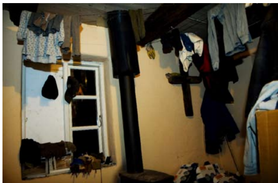
Trængt med plads. Der er ikke meget plads til fem mennesker og deres ejendele. Badeværelset fungerer, som kombineret bad, bryggers, toilet og opbevaringsrum.

Oppe for enden af den gamle slidte trappe sover de. Fem mand på hver sin madras. Rummet, de sover i, er omtrent størrelsen af et almindeligt børneværelse.